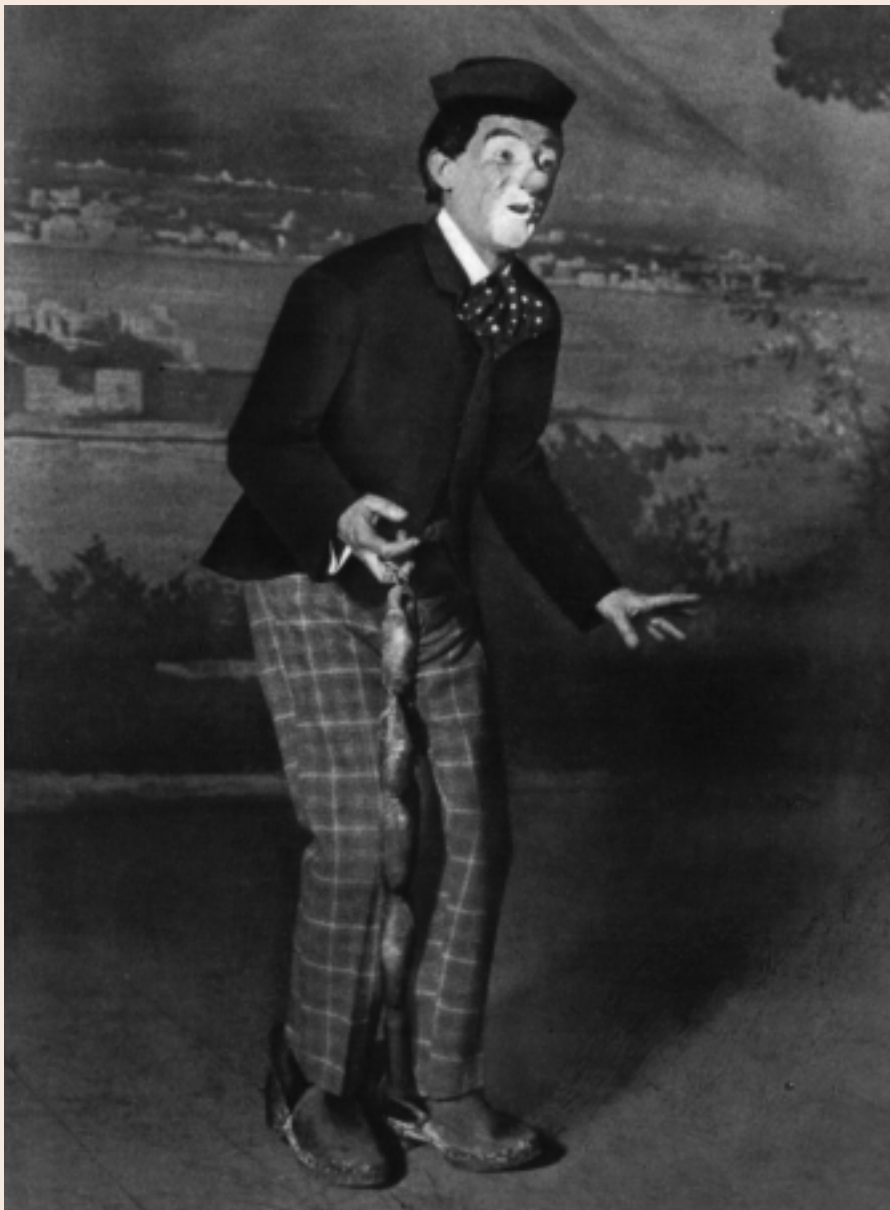
Ettore Petrolini nel 1911: I Salamini

raccoglie preziosi copioni manoscritti (macchiette e commedie), partiture di scena, centinaia di fotografie, manifesti, locandine, programmi, una vastissima raccolta di recensioni che parte dal 1902, oggetti di scena, contratti e borderò. Una tale raccolta è parte delle tradizioni teatrali del nostro paese; ma se le istituzioni dimenticassero che il patrimonio della cultura italiana è fatto anche di queste realtà, ripeterebbero, meno appropriatamente, l'atteggiamento di Petrolini, che insignito di un'alta onorificenza dello stato fascista esclamò: "me ne fregio".