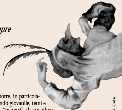
IL CAPITAN BARBEO E CUCUBA IGNOTO SECOLI XVII-XVIII, MILANO, MUSEO TEATRALE ALLA SCALA

Il Teatro della Pergola, Centro di Promozione Teatrale, si espone con le sue proposte e con la sua necessità di incontrare il pubblico, a critiche e lodi, protagonista di una nuova storia.