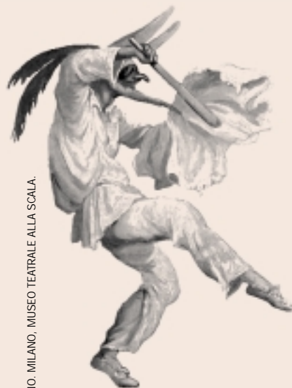
IGNOTO SECOLI XVII-XVIII, FRANCA TRIPPA E FRITTELLINO, MILANO, MUSEO TEATRALE ALLA SCALA.

Scrittore, autore, scenografo, globe-trotter. Tra tecnologia, poesia e pedagogia, emerge il regista del Duemila.