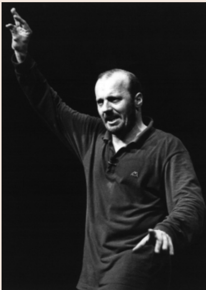
Marco Paolini, ospite degli incontri sulla "Narrazione a Teatro"